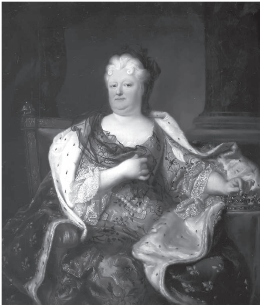
Єлизавета-Шарлота Орлеанська (портрет пензля Гіацинта Ріго)

Відома ще й під іменем Лізелота фон Пфальц (1652–1722), а також знана листами із Версая до Німеччини. Серед інших новомодних штукоч при дворі Людовіка XIV вона нарікала й на смак нових напоїв – кави, чаю та шоколаду