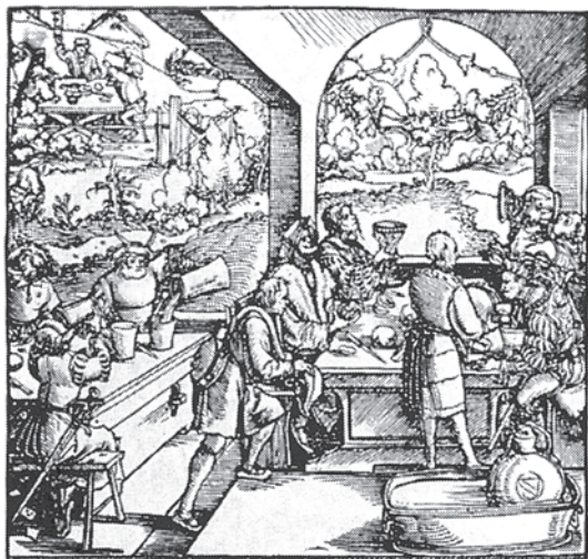
«Застілля багатіїв» Ганса Бургкмайра